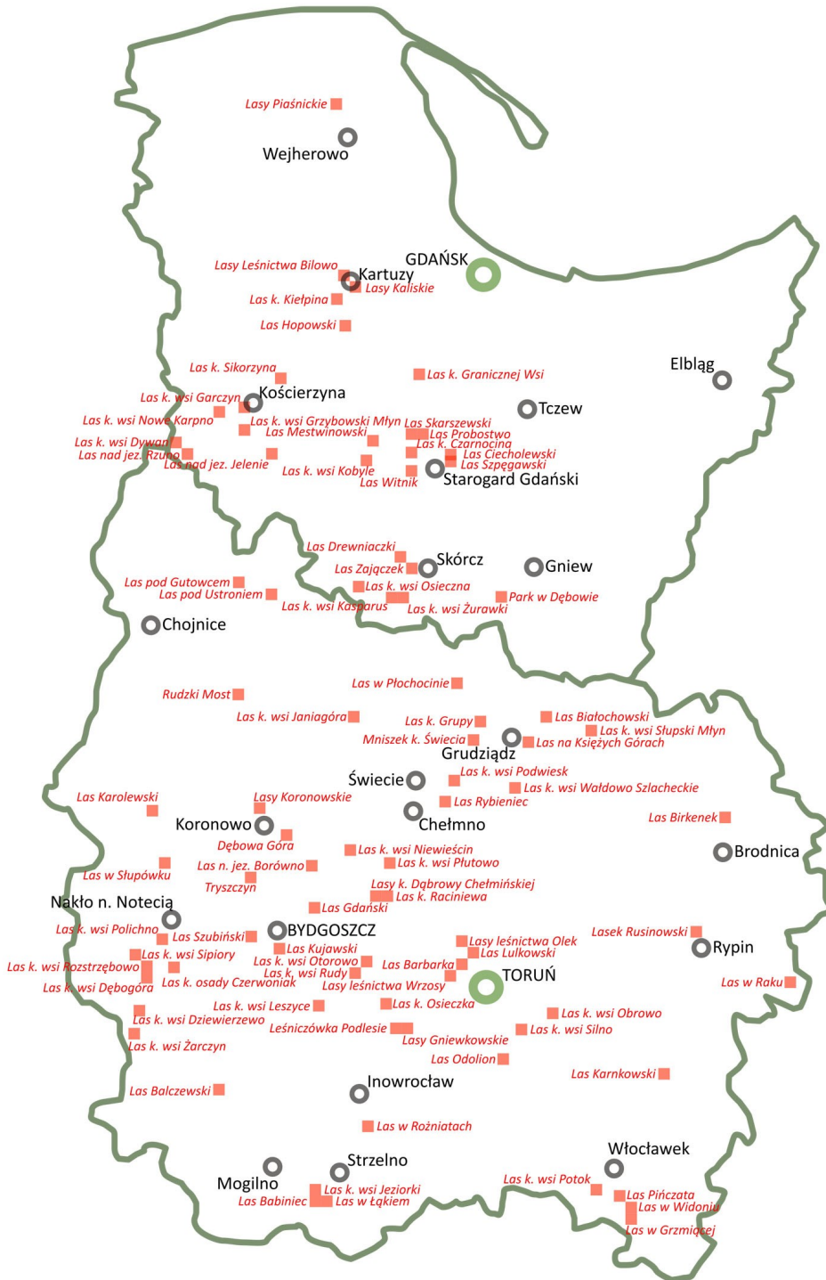
Rycina 3. Miejsca Zbrodni Pomorskiej 1939 roku w lasach Pomorza i Kujaw w zarządzie regionalnych dyrekcji Lasów Państwowych w Gdańsku i Toruniu.

Przeprowadzona ocena wartości zabytkowej leśnych obszarów Zbrodni Pomorskiej na terenie objętym badaniami wykazała jej silne zróżnicowanie. Stwierdzono, iż ponad połowa badanych obszarów (45) charakteryzuje się niską wartością zabytko-