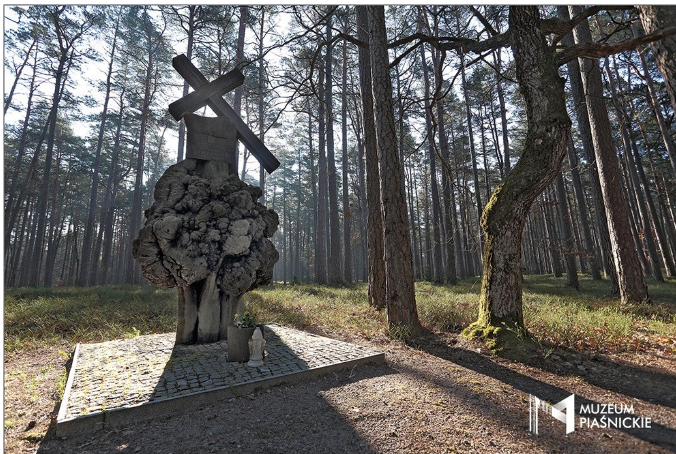
Rycina 2. Lasy Piaśnickie, pomnik leśników pomordowanych w czasie Zbrodni Pomorskiej 1939 roku, zdj. Marek Jasiński. Źródło: Muzeum Piaśnickie w Wejherowie

Figure 2. Forests of Piaśnica, memorial to the foresters murdered during the Pomeranian Crime of 1939, photo by Marek Jasiński. Source: Museum of Piaśnica in Wejherowo